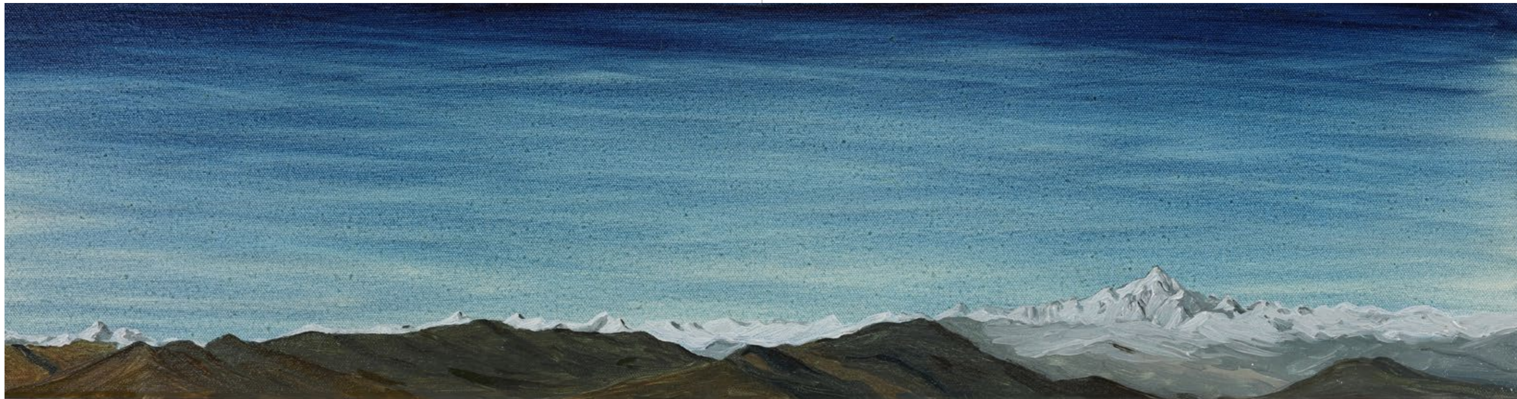
Orizzonte orizzontale, 2022