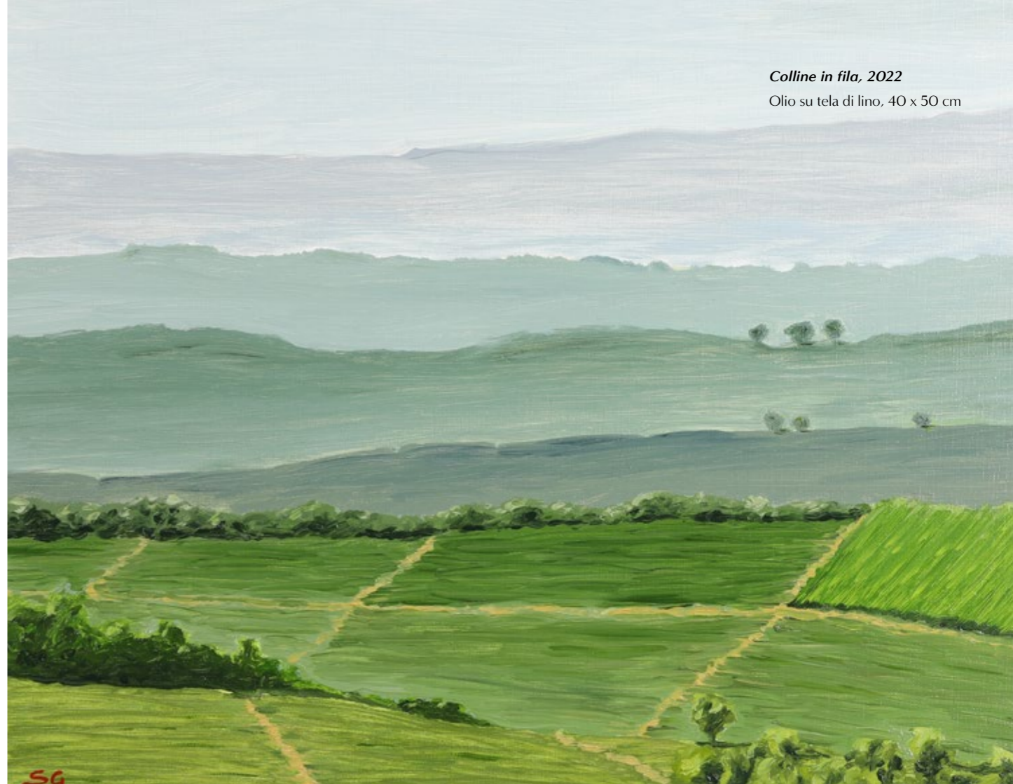
Colline in fila, 2022 Olio su tela di lino, 40 x 50 cm