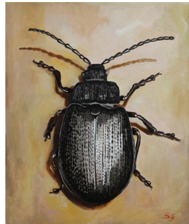
Coleottero nero, 2012 Olio su tela di juta, 60 x 50 cm