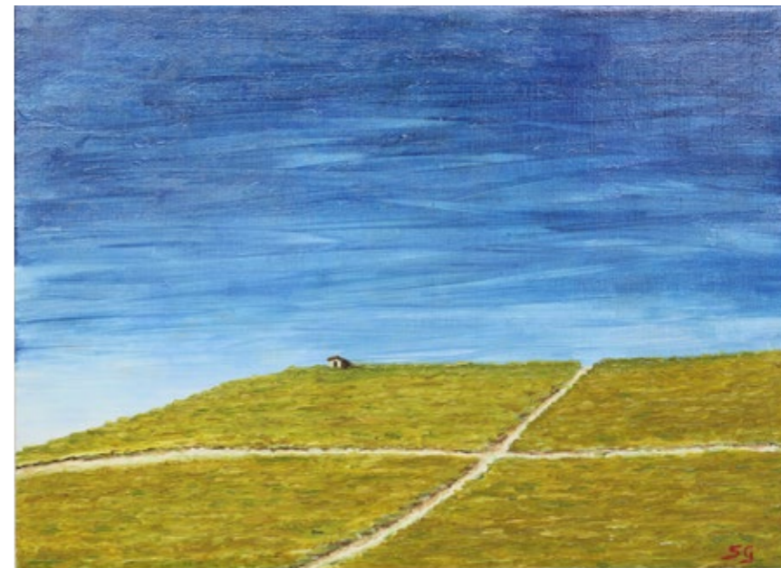
Quattro vigne e un ciabot 2022,