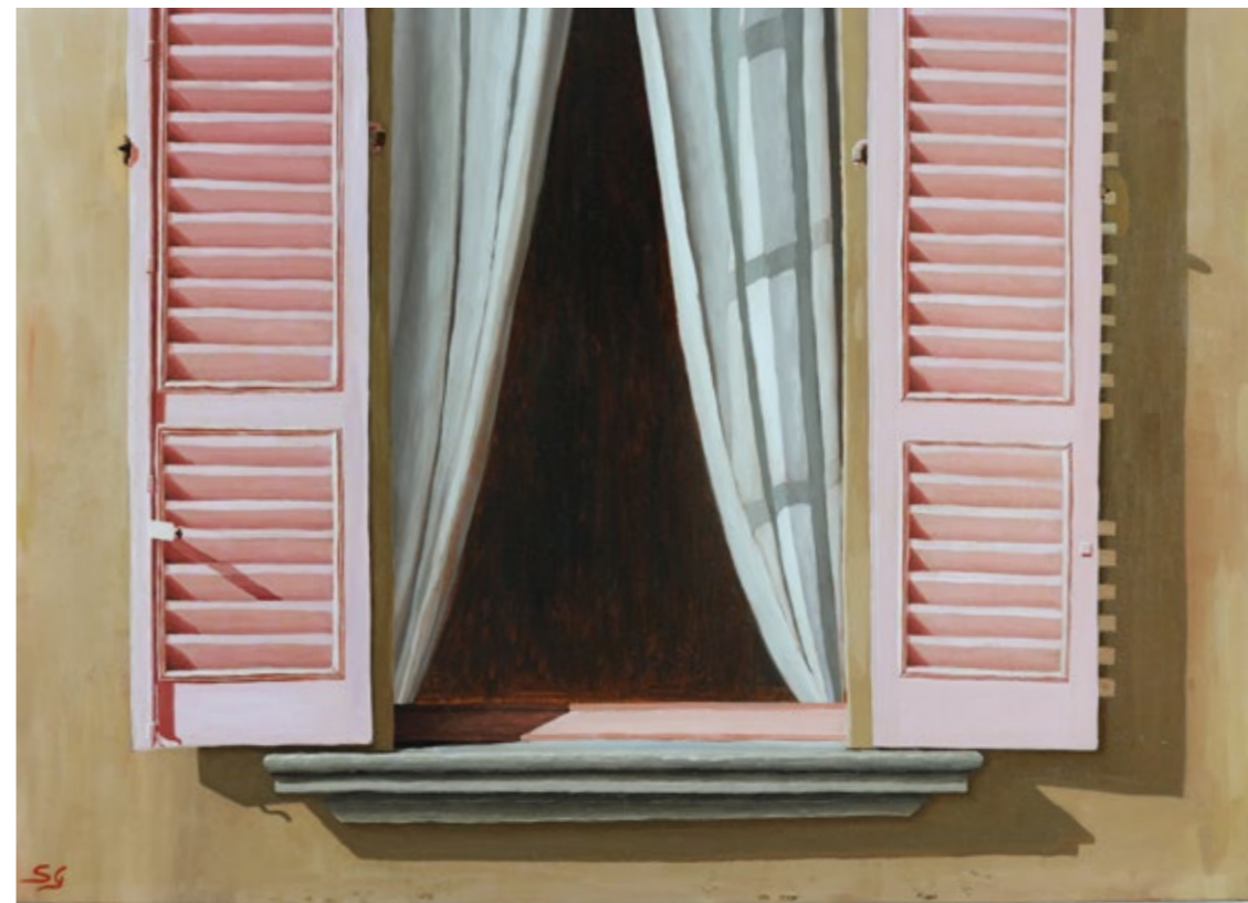
La finestra rosa, 2011 Olio su tela, 50 x 70 cm