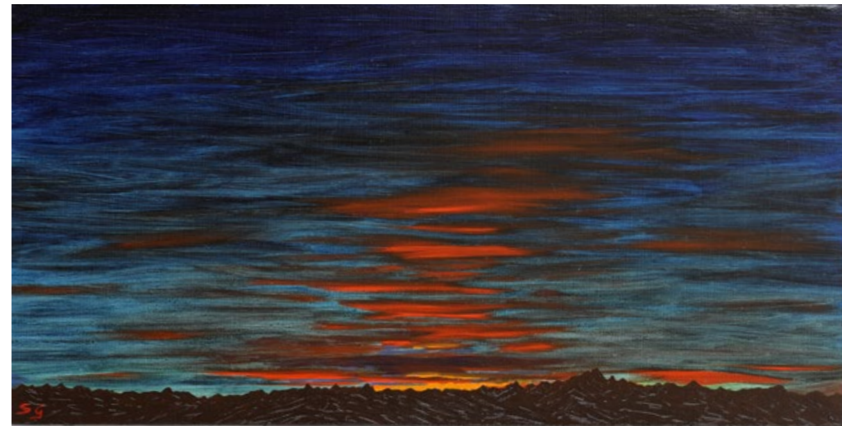
Tramonto scuro, 2022 Olio su tela di lino, 30 x 60 cm