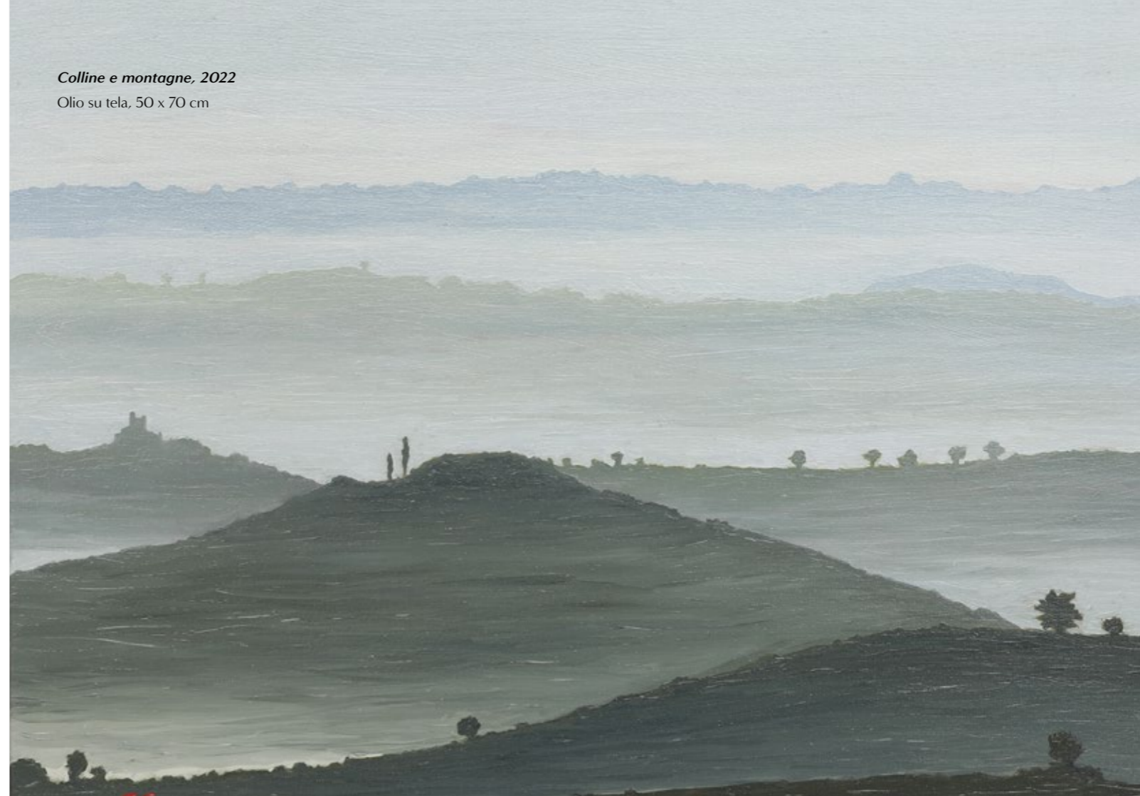
Colline e montagne, 2022 Olio su tela, 50 x 70 cm