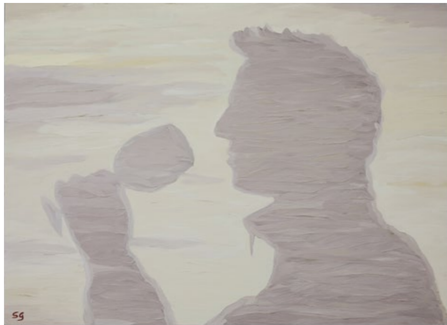
Ombre alcoliche, 2017 Olio su tavola, 43 x 59 cm