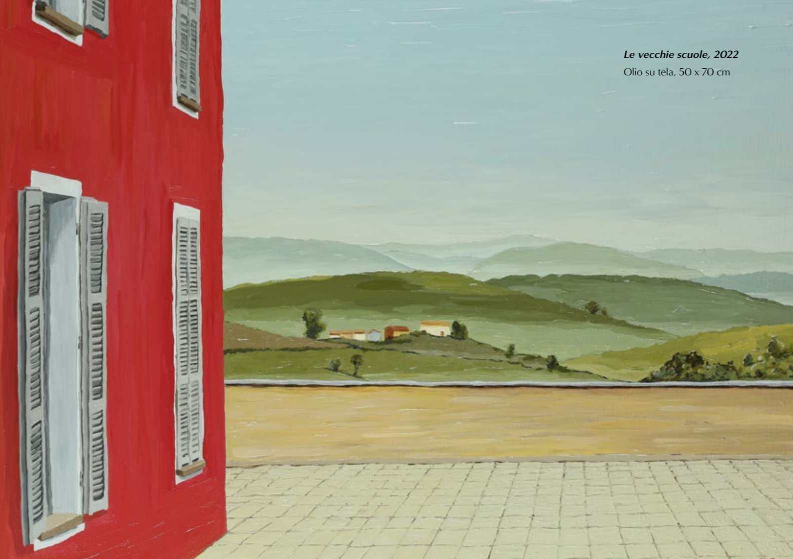
Le vecchie scuole, 2022 Olio su tela, 50 x 70 cm