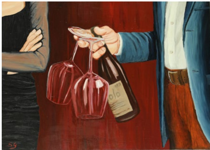
Barolo?, 2022 Olio su tela, 50 x 70 cm