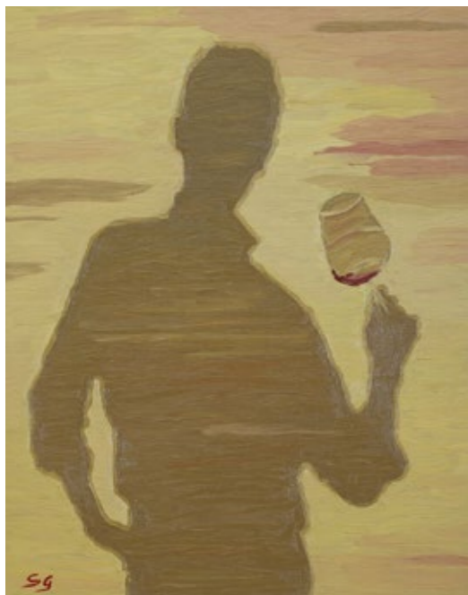
Ombra di degustazione 2, 2022 Olio su tela, 50 x 35 cm