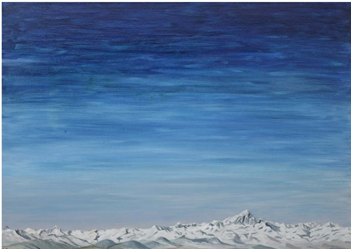
Alpi d'inverno, 2020 Olio su tela, 50 x 70 cm