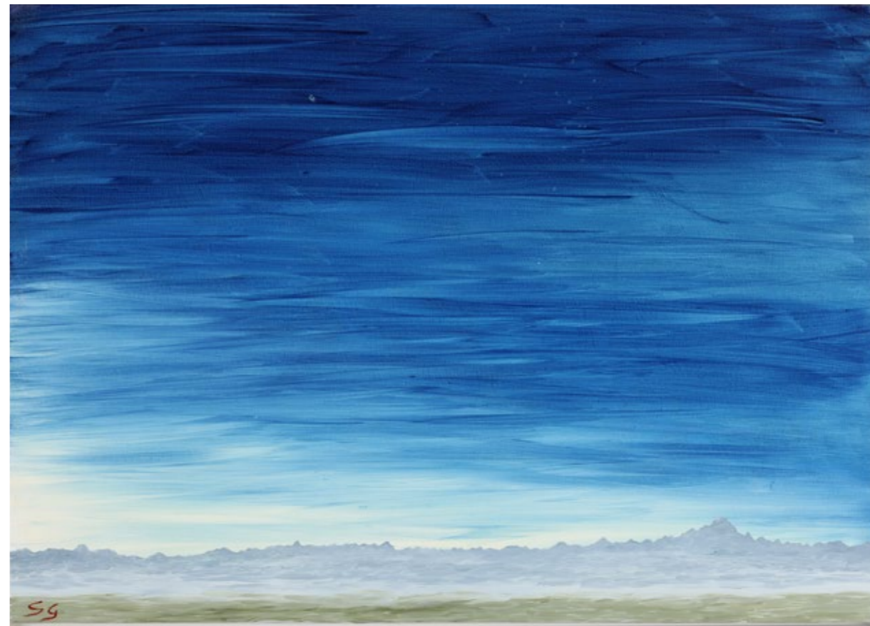
Alpi dalle Langhe 2022, Olio su tela, 50 x 70 cm