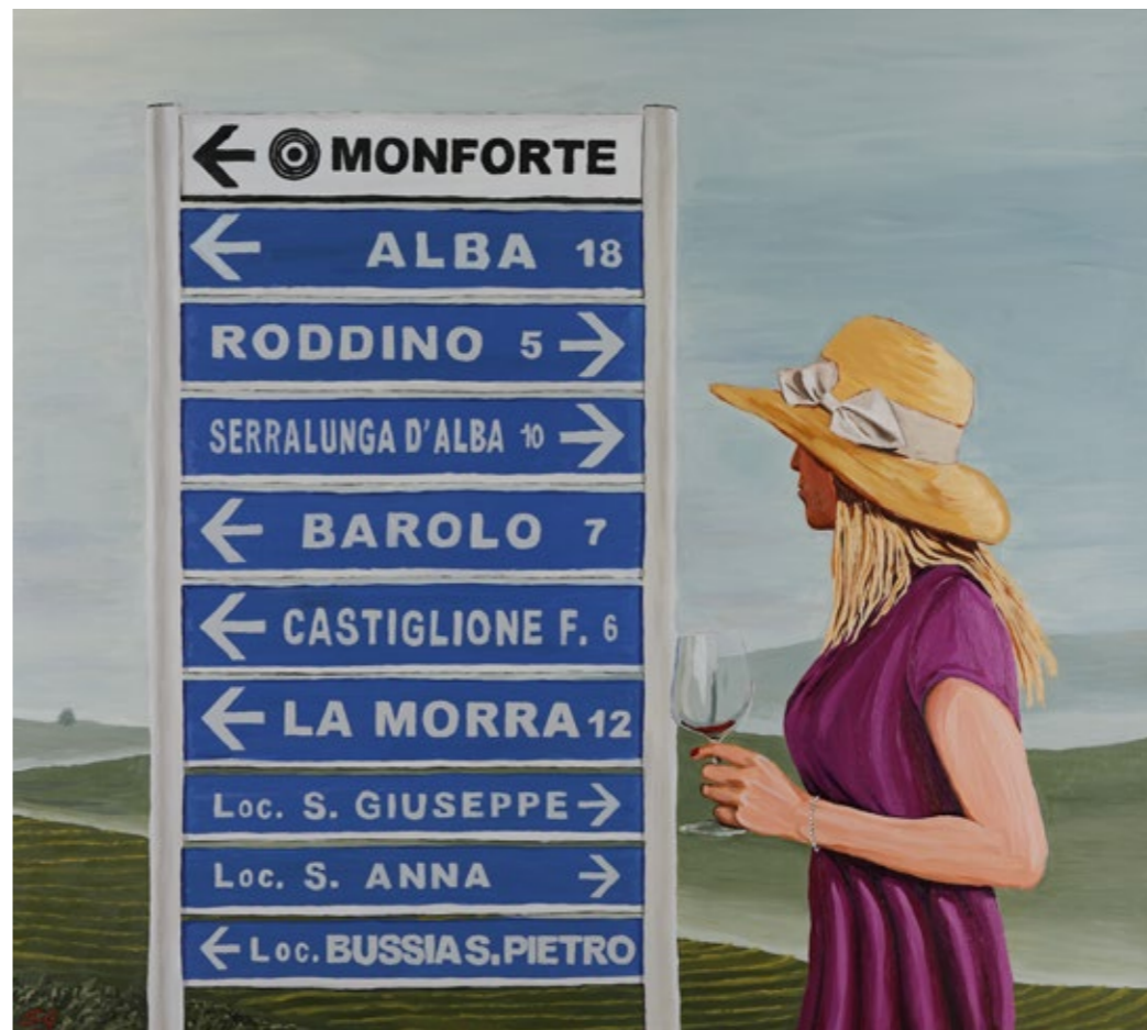
Andare o restare, 2022 Olio su tela, 80 x 90 cm