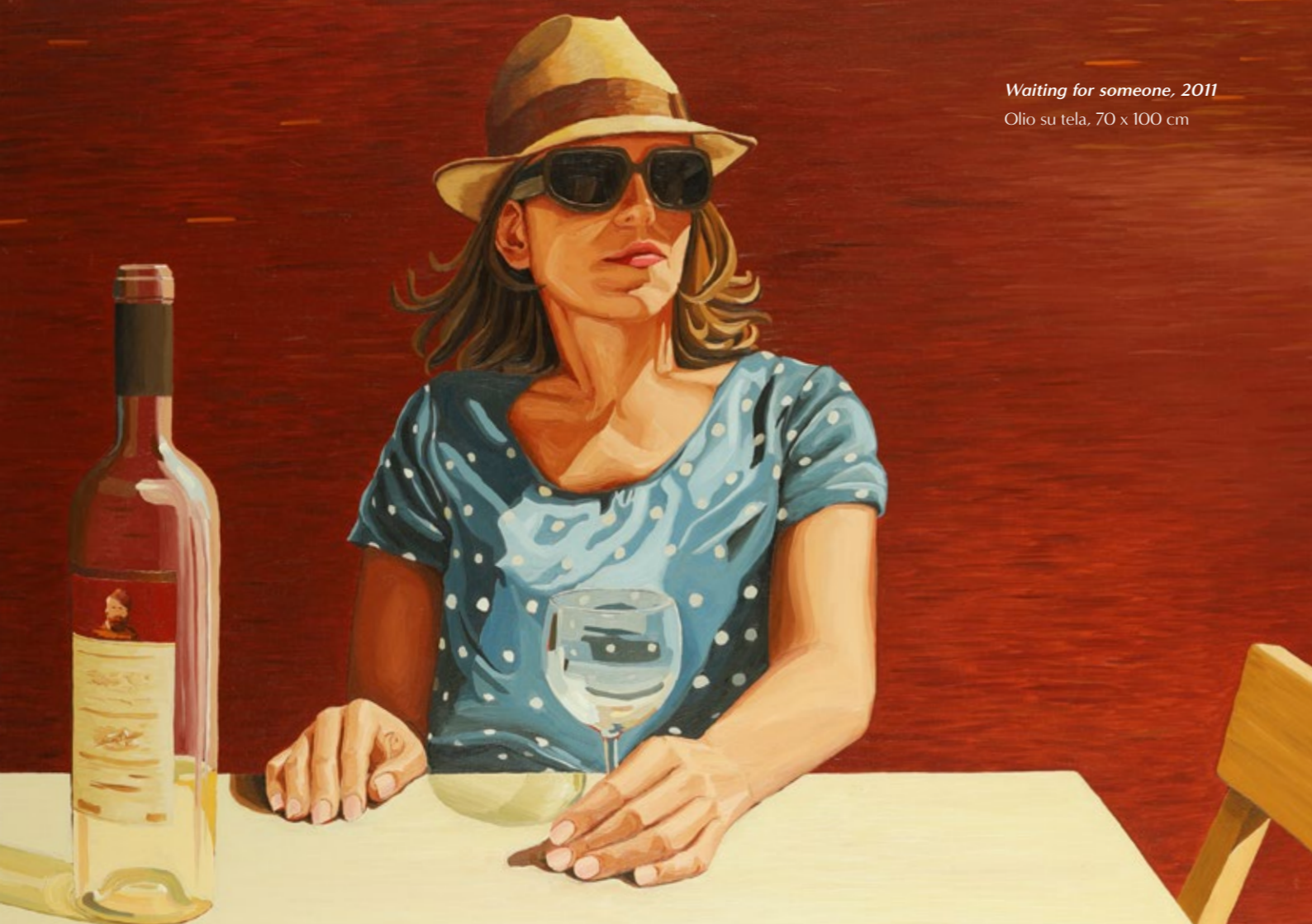
Waiting for someone, 2011 Olio su tela, 70 x 100 cm