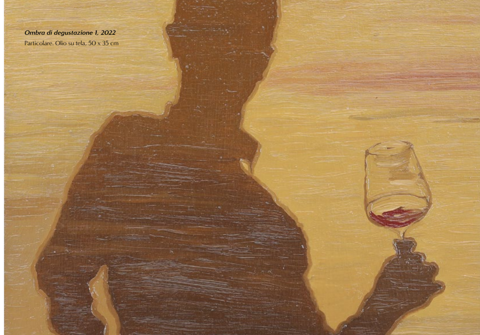
Ombra di degustazione 1, 2022 Particolare. Olio su tela, 50 x 35 cm