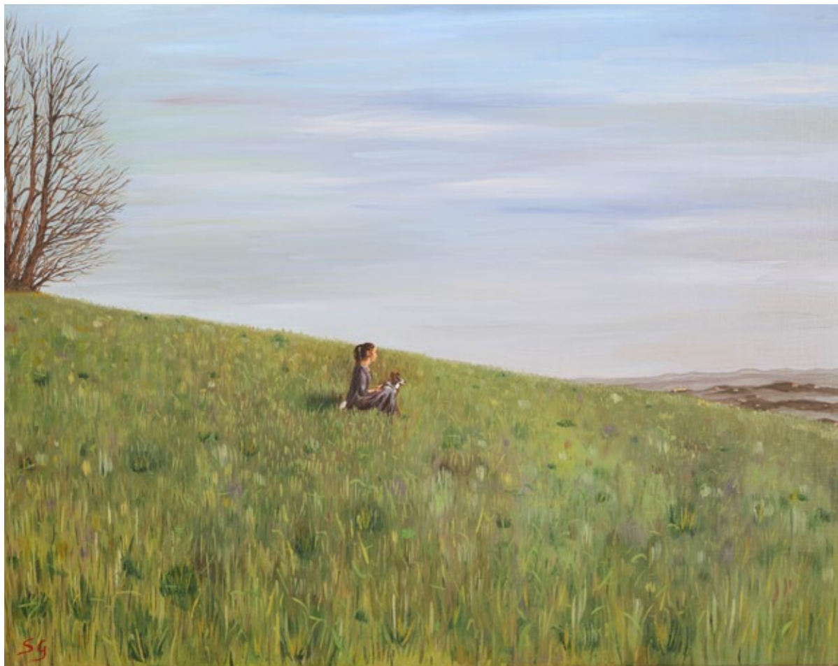
Lockdown, 2022 Olio su tela di lino, 73 x 92 cm