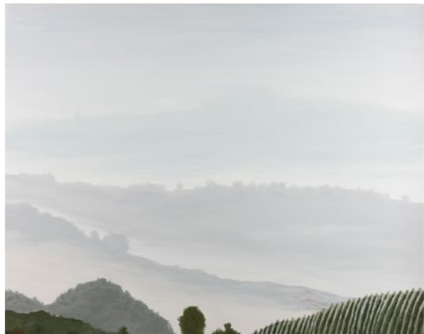
Nebbia a San Sebastiano, 2022 Olio su tela, 80 x 100 cm