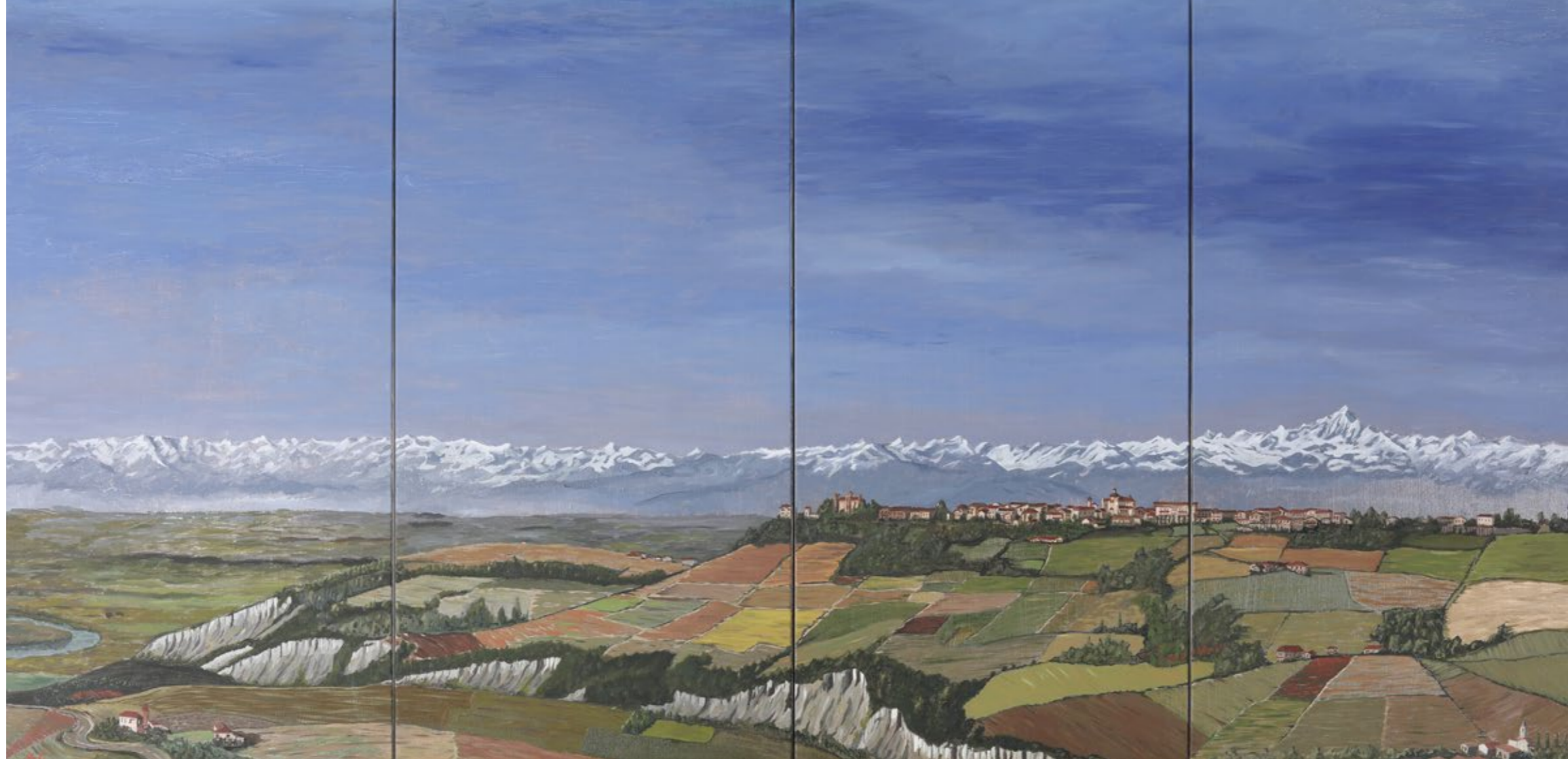
Novello e montagne, 2022

Olio su tela, 100 x 200 cm, composizione di 4 pannelli, ciascuno 100 x 50 cm