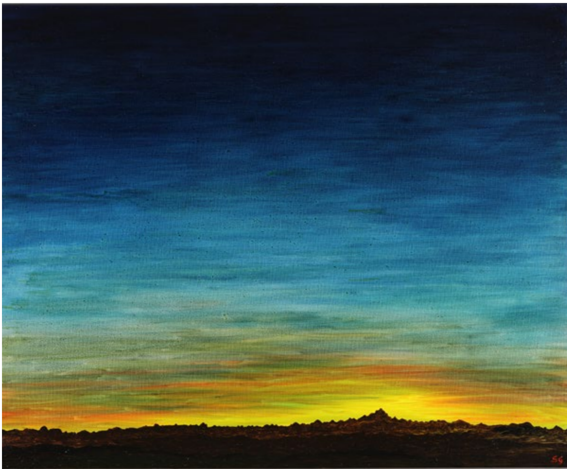
Tramonto dalle Langhe, 2022 Olio su tela, 80 x 100 cm